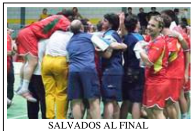
SALVADOS AL FINAL

revelación de la temporada al alcanzar el club un meritorio octavo puesto en la temporada de su debut en la DH. La pasada temporada el club había apostado por jugadores con proyección para unirse a los más veteranos de la plantilla, en una mezcla que podría haber dado interesantes resultados. De hecho el Balonmano Huesca había compuesto la plantilla más joven de la DH. La realidad fue otra, cese de Txema incluido, el equipo acabo disputando la promoción con