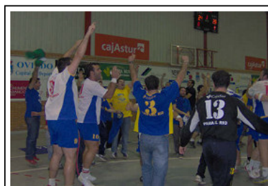
ASCENSO A TRAVES PROMOCION